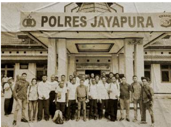
Penangguhan 20 tahanan politik yang ditangkap saat aksi 1 Desember 2019. Kasus mereka ditangguhkan Polres Jayapura pada 19 Desember 2019.

dan jaringan. Saya juga berprinsip bahwa sebagai manusia harus berproses dengan masalah biar jadi lebih baik”.