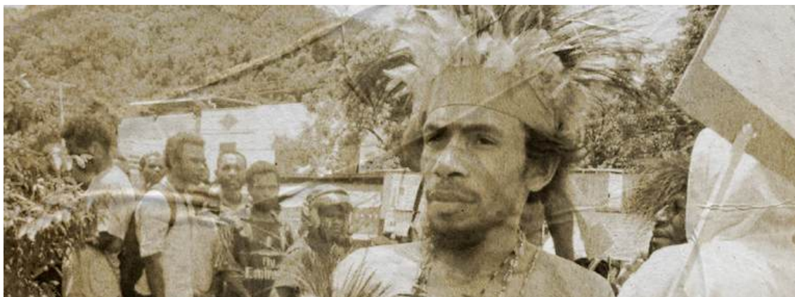
Alfares Kapisa

buku Tindak Pidana Makar Menurut KUHP yang ditulis dan diterbitkan pada 1985, kata “makar” merupakan terjemahan dari kata “ aanslag ” yang berarti “serangan”. KUHP kita tidak memberikan definisinya, tetapi hanya penafsiran yang otentik (khusus) yang terdapat dalam Pasal 87 KUHP. Demikian juga menurut Lamintang, jika dihubungkan dengan tindak pidana yang diatur dalam Pasal 104 KUHP, kiranya “ aanslag ” hanya tepat diartikan sebagai aanval (serangan) atau sebagai misadadige aanranding (penyerangan dengan maksud tidak baik). Hal yang sama juga menurut Wirjono Prodjodikoro yang menggunakan kata “makar” sebagai terjemahan kata “ aanslag ”, yang menurut beliau adalah “serangan”. Sehingga dapat dipahami bahwa menurut Wirjono Prodjodikoro, “ aanslag ” adalah “serangan.” Serta menurut R. Soesilo dalam komentarnya terkait KUHP, disebutkan bahwa “ aanslag ” (makar atau penyerangan) itu biasanya dilakukan dengan perbuatan kekerasan”. Bahwa kemudian perbuatan makar ( aanslag ) ditujukan tergantung pada tujuan yang tercantum pada pasal.