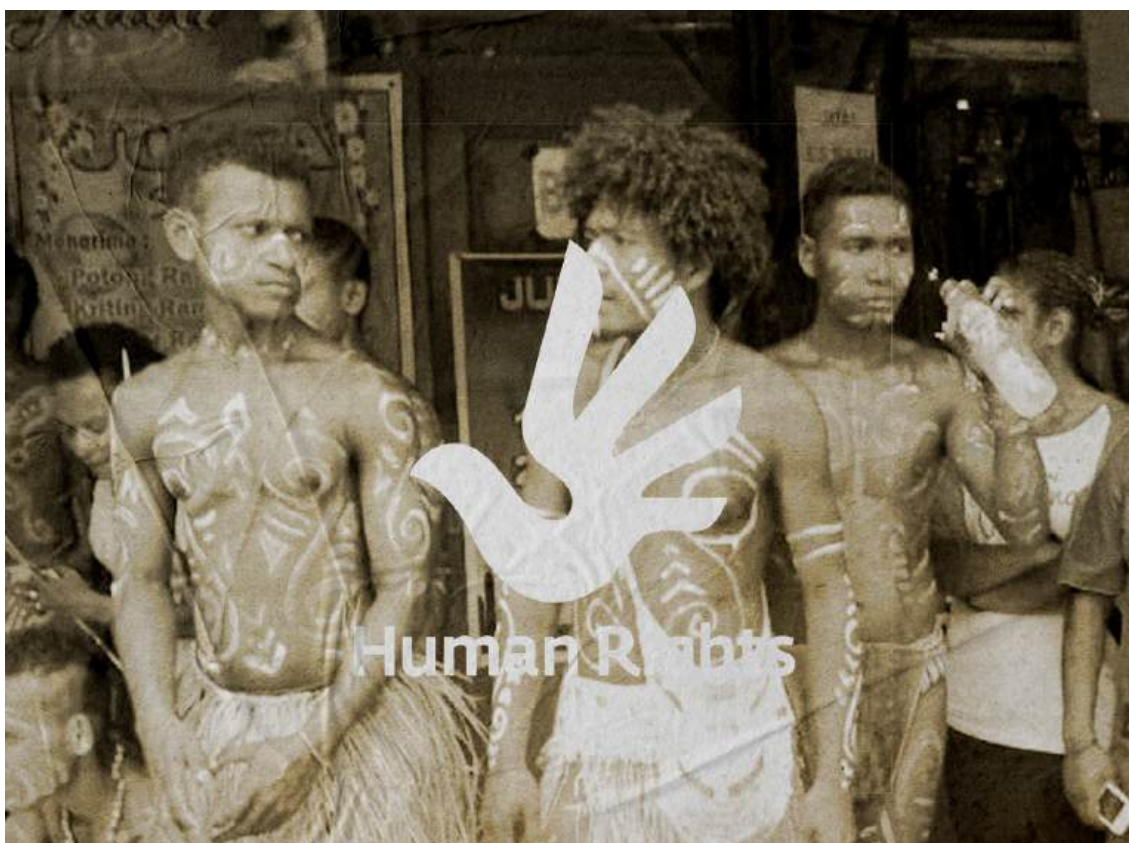
Demonstrasi bertema selamatkan budaya Papua, Jayapura, 17 Februari 2014.

Dalam konteks penerapan pidana makar terhadap para aktivis politik Papua yang relevan adalah kategori II dan III. Hal ini bisa dilihat dari beberapa pertimbangan khusus UNWGAD akan beberapa kasus individual di Indonesia lewat kerja-kerja formal mereka.