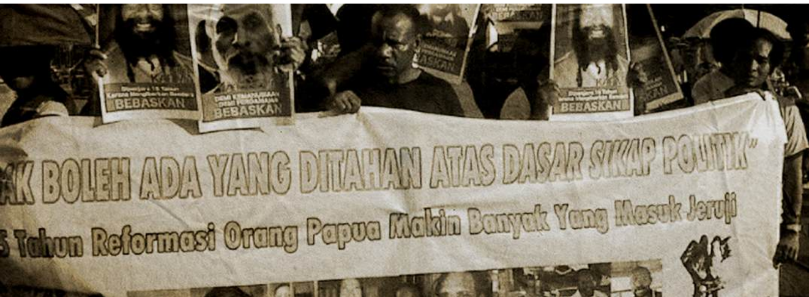
Demonstrasi National Papua Solidarity (NAPAS) mendesak pembebasan tahanan politik, Mei 2013.

memilih “aman”, padahal sulit juga untuk dipahami, ketika tuntutan 10 tahun diputus 5 tahun, apa yang menjadi pertimbangan majelis ketika memutuskan menjadi 5 tahun, tidak pernah terungkap di persidangan.