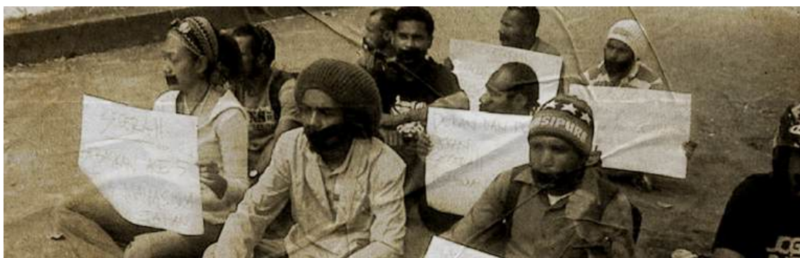
Aksi Bisu