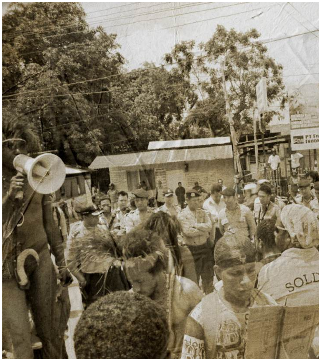
Demonstrasi bertema selamatkan budaya Papua, Jayapura, 17 Februari 2014.

memperbolehkan suatu pembatasan hak-hak tertentu berdasarkan pertimbangan, seperti moralitas, nilai-nilai agama, keamanan nasional, dan ketertiban umum, pembatasan tersebut harus bisa diuji oleh prinsip-prinsip yang ketat, yaitu dilakukan oleh penetapan hukum yang absah, proporsional, dan dalam konteks melindungi masyarakat yang demokratis. Pasal-pasal makar (khususnya Pasal 106 dan 110 dari KUHP) dan implementasinya, melanggar sejumlah hak yang, sebagai negara pihak dalam instrumen-instrumen HAM internasional, Indonesia memiliki kewajiban internasional untuk menghormati dan menjamin.