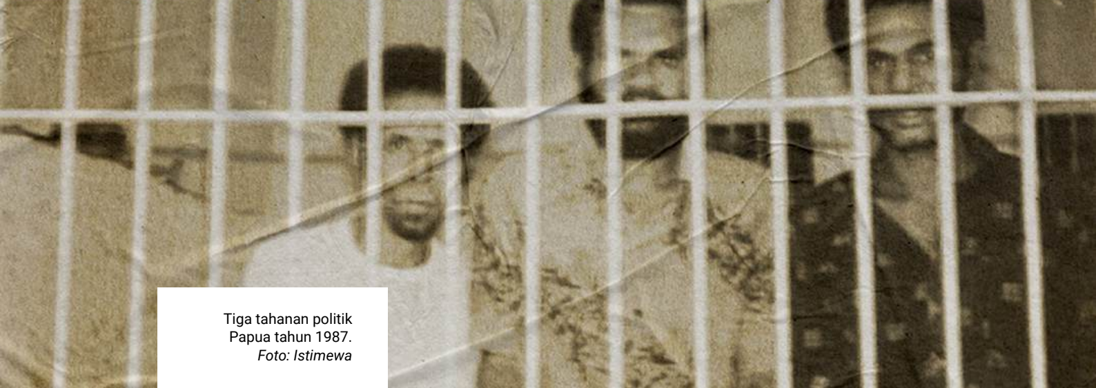
Tiga tahanan politik Papua tahun 1987.