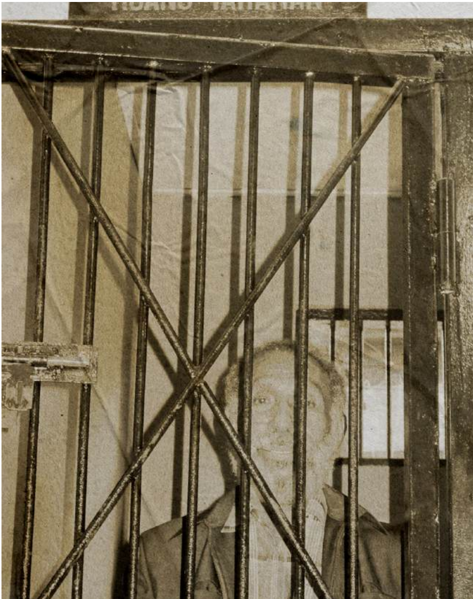
Forkorus Yaboisembut di Kejaksaan Negeri Jayapura, 16 Desember 2011.

“Setiap orang asing yang dengan sengaja menyalahgunakan atau melakukan kegiatan yang tidak sesuai dengan maksud dan tujuan pemberian Izin Tinggal yang diberikan kepadanya dipidana dengan pidana penjara paling lama 5 (lima) tahun dan pidana denda paling banyak Rp500.000.000,00 (lima ratus juta rupiah).”